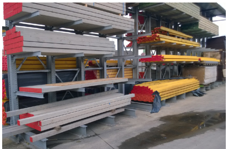
Ook voor buitengebruik (warm gegalvaniseerd)