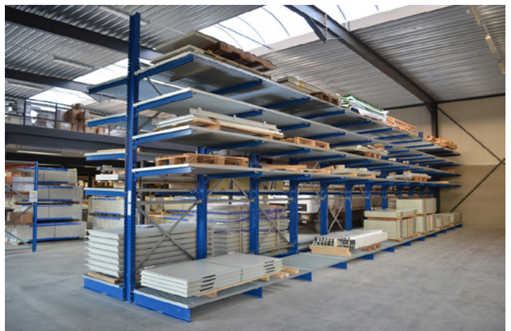
Kan uitgerust worden met rooster- of spaanplaat legvlakken